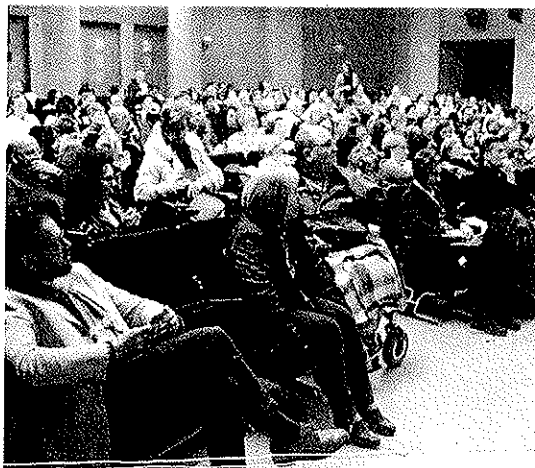
El Auditorio de la Escuela Andaluza de Salud Pública, repleto.